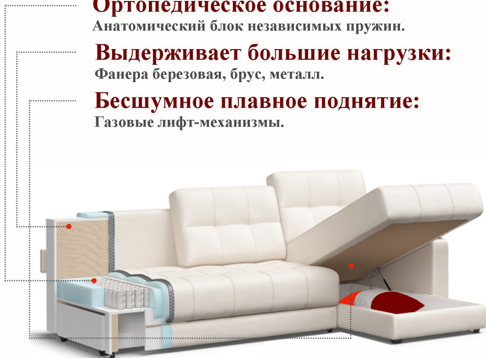
2 бельевых ящика

Для любящих комфортный сон, ведущих здоровый образ жизни. Срок службы 7 лет.